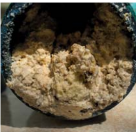
Effizienter Kalkschutz für Trinkwasserleitungen und Warmwasserspeicher