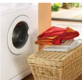
Weiche Wäsche, gewebeschonend. Weniger Wasch- und Reinigungsmittel