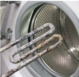
Energieeinsparung und längere Lebensdauer bei Haushaltsgeräten