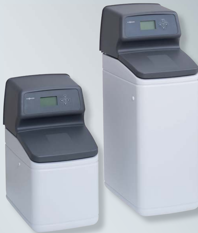
Typ VS 19D