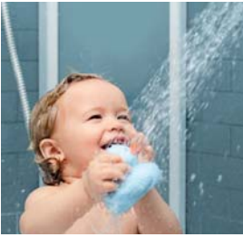
Geschmeidige Haut und seidiges Haar durch weiches Wasser