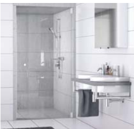
Hochglanz im Bad durch deutliche Reduzierung von Kalkablagerungen